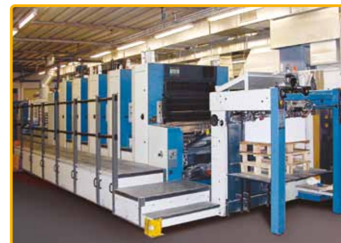
Forno GST/UV su KBA Rapida 105, 5 colori + L

La rotazione pneumatica dei riflettori è sincronizzata elettricamente con la macchina offset permettendo arresti di servizio senza lo spegnimento delle lampade U.V. che, in tal caso, funzionano a potenza ridotta.