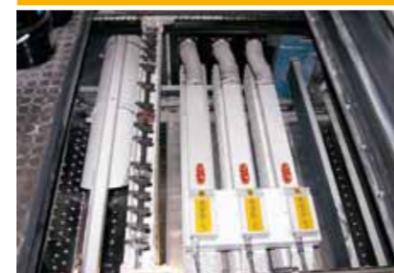
Vista moduli GST/UV su uscita prolungata