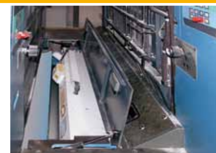
Installazione modulo interdeck GST/UV mod. D