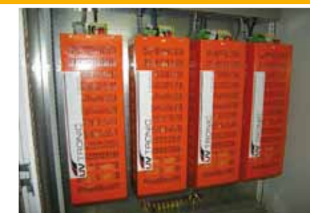
Dispositivo UV TRONIC